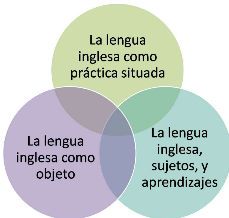
Figura 1. Los tres ejes de la formación específica.