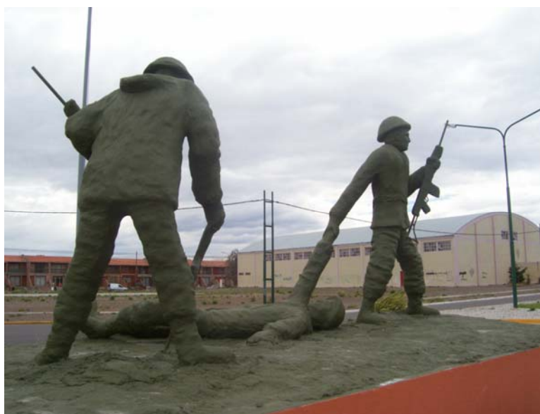
MONUMENTO A LOS CAÍDOS- RAWSON