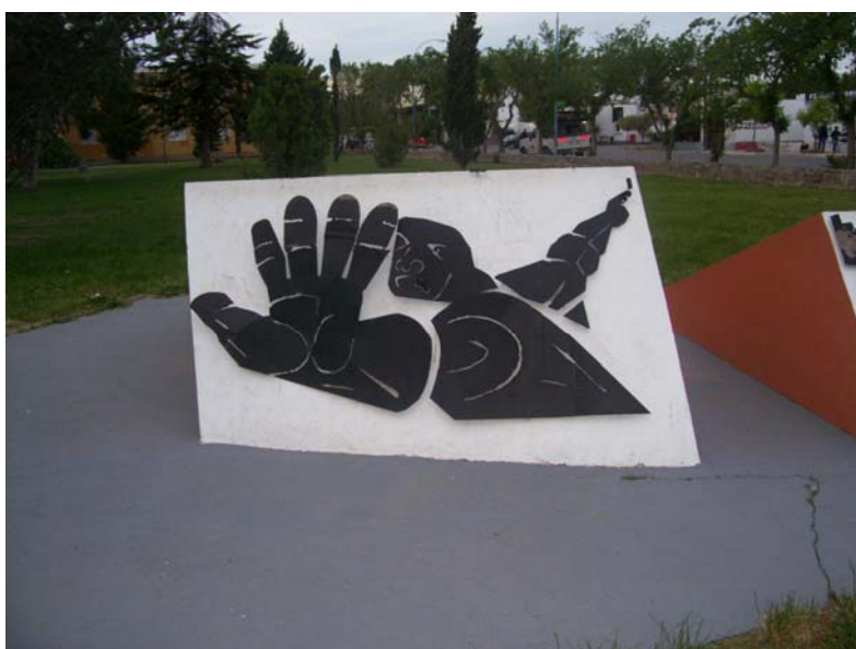
GIMNASIO MUNICIPAL “HÉROES DE MALVINAS”-PLAYA UNIÓN.