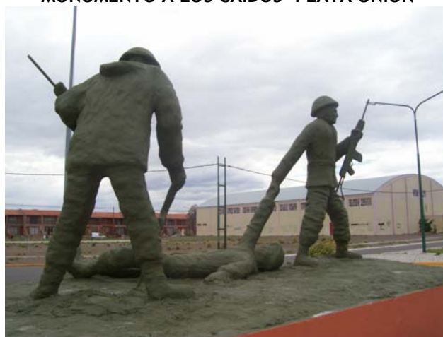
MONUMENTO A LOS CAÍDOS- PLAYA UNIÓN

Este monumento representa el sentido de patriotismo, solidaridad, valor y coraje puesto en manifiesto por los compatriotas que participaron de esa parte de la historia. “Patriotismo” porque lucharon defendiendo a su patria. “Solidaridad” ante el compañero herido en el campo de batalla. “Valor” porque tuvieron la fortaleza y ánimo para cumplir con su deber de ciudadano armado en defensa del territorio nacional. “Coraje” ante la adversidad manteniendo en alto el espíritu combativo.